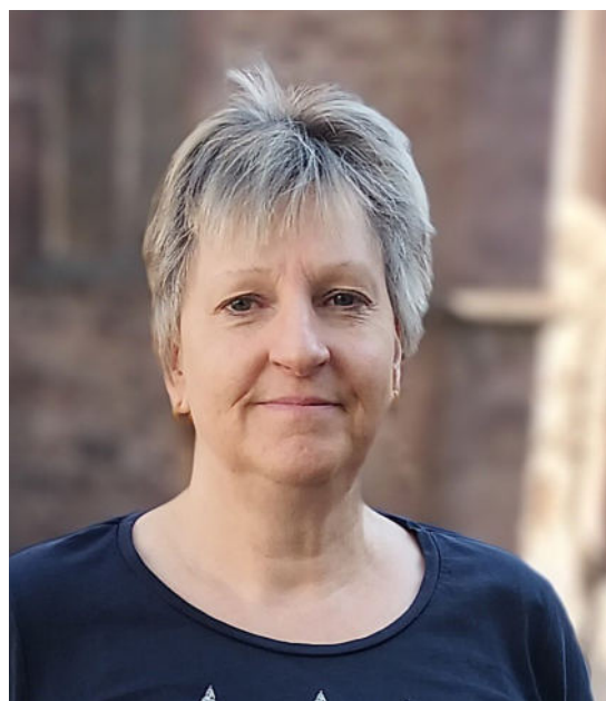
Text: Gunnar Wirth

Wir wünschen ihr für die Zukunft alles erdenklich Gute: Gottes Segen für ihren weiteren Weg, Zeit und Muße für Dinge, die ihr am Herzen liegen, Gesundheit und Zufriedenheit. Sie wird in Beverungen wohnen bleiben und wir hoffen, sie möglichst oft zu sehen – demnächst ganz pflichtenfremd und entspannt.